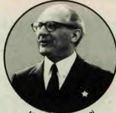
ASBP BİRİNCİ SEKRETERİ ERICH HONECKER

Raporda, Pekin'in büyük güç sovenizmi ve anti-sovyet